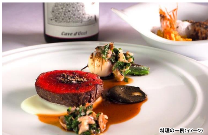
料理の一例(イメージ)