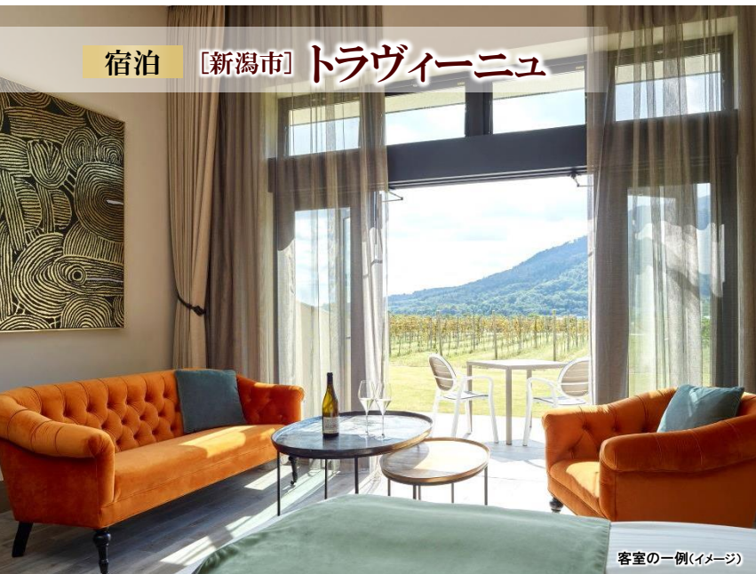
客室の一例(イメージ)