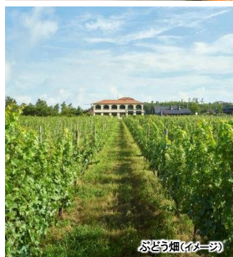
ぶどう畑(イメージ)