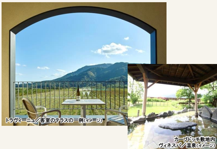
トラヴィーニュ/客室のテラスの一例(イメージ)