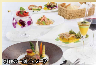
料理の一例 / イメージ