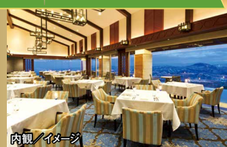
内観 / イメージ