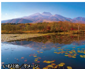
いもり池 / イメージ

❖80余年の歴史を持つ標高約1000mのリゾートホテル『赤倉観光ホテル』にゆったり連泊します。客室の温泉露天風呂からは野尻湖を望む絶景をお楽しみください。連泊ならではのゆとりの行程で紅葉の信越を巡ります。