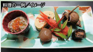
料理の一例 / イメージ