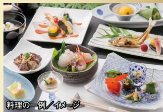
料理の一例 / イメージ