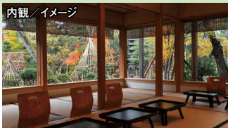
内観 / イメージ