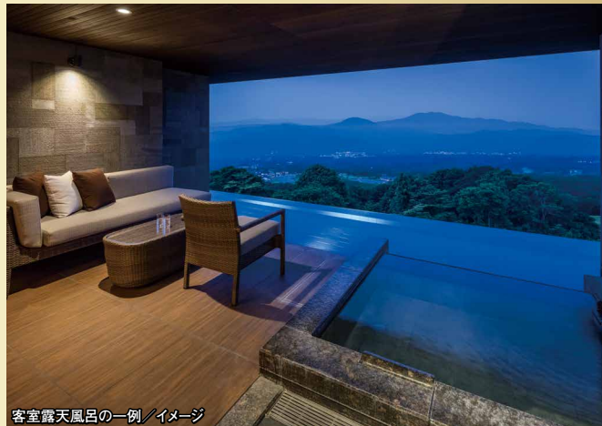
客室露天風呂の一例 / イメージ