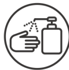
アルコール消毒液を設置