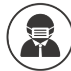
添乗員、乗務員のマスク着用