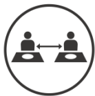
移動中や食事中の十分な間隔の確保