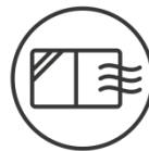
移動中や施設内での換気の励行