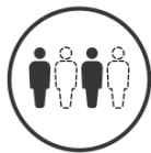
少人数ツアーの実施

ご宿泊施設やご利用施設の選定、バス・ハイヤーにおける感染予防対策、添乗員、及びドライバー、ガイドなどの感染予防対策、ご参加者様の体調管理、及び感染予防を心掛けます。ご不明・ご心配な点がございましたらお気軽にお問い合わせください。