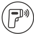
非接触型体温計にて検温を実施