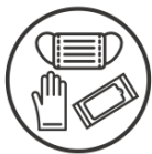
マスク、使い捨て手袋、除菌シートを配布 ※