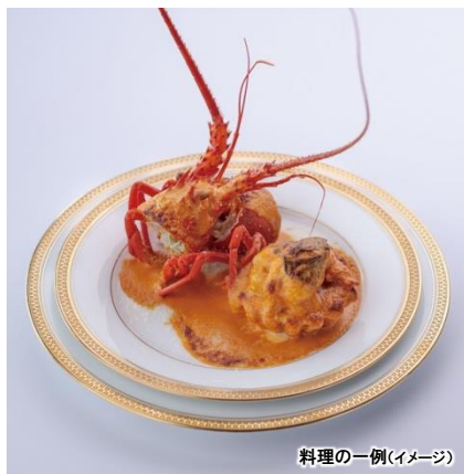
料理の一例(イメージ)