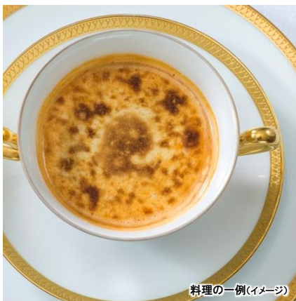
料理の一例(イメージ)

志摩観光ホテルは2021年4月3日(土)に開業70周年を迎えます。 開業70周年記念企画として、故高橋忠之シェフから続く歴代総料理長をテーマに志摩観光ホテルの「食の歴史」の物語をたどる晩餐会を開催いたします。