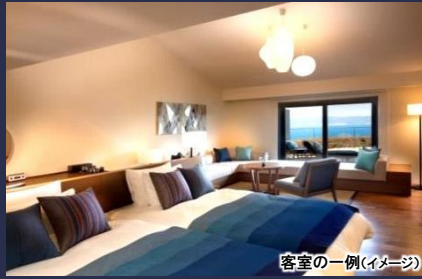
客室の一例(イメージ)