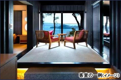
客室の一例(イメージ)