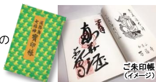
ご朱印帳(イメージ)