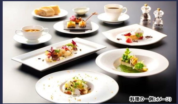
料理の一例(イメージ)