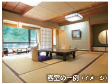
客室の一例 (イメージ)