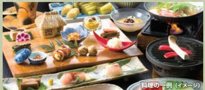
料理の一例 (イメージ)