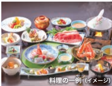
料理の一例 (イメージ)