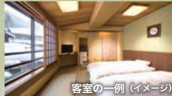
客室の一例 (イメージ)