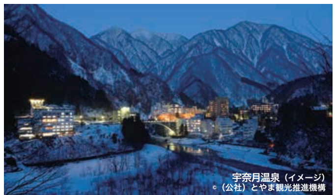
宇奈月温泉 (イメージ) ○ (公社) とやま観光推進機構

雪国ならではのダイナミックな景色と名湯を求めて、宇奈月温泉と野沢温泉を訪ねます。泉質の良さはもちろん、その土地ならではの冬の味覚を美味しいお酒を楽しみます。今回は温泉重視のお宿をご用意しました。2日目は素朴な温泉旅館です。雪国ならではのあたたかいサービスを満喫していただけます。