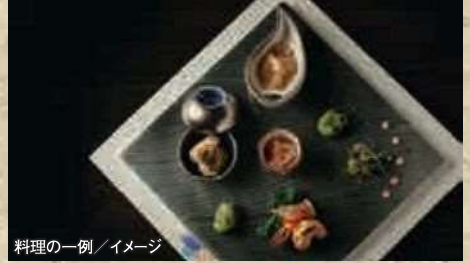
料理の一例/イメージ