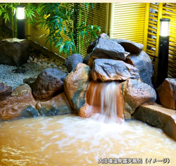
大浴場温泉露天風呂 (イメージ)