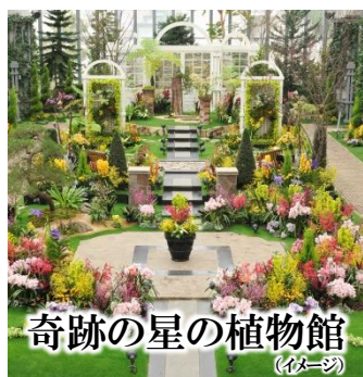
奇跡の星の植物館 (イメージ)