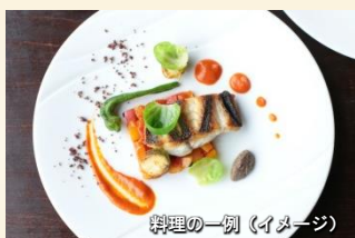
料理の一例 (イメージ)