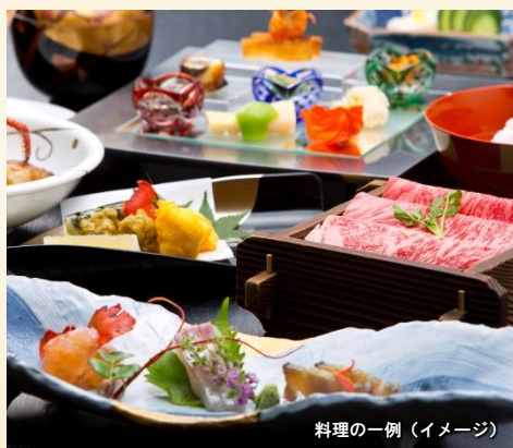
料理の一例 (イメージ)

数奇屋の佇まいが美しい、有馬温泉を代表する旅館です。きめ細やかなおもてなしをお楽しみください。