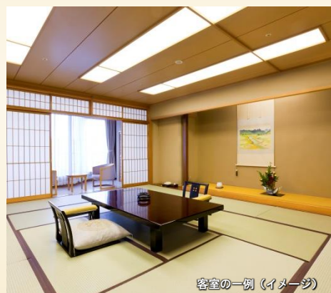
客室の一例 (イメージ)