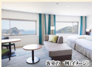
客室の一例(イメージ)