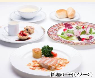
料理の一例(イメージ)