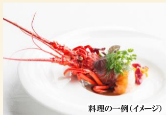
料理の一例(イメージ)