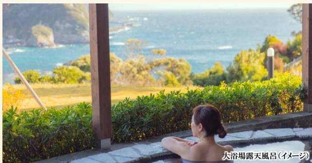
大浴場露天風呂(イメージ)