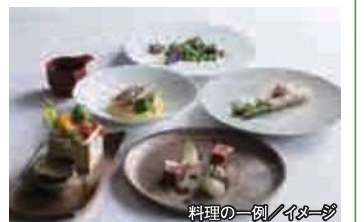
料理の一例 / イメージ