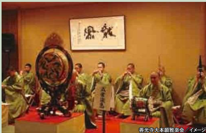
善光寺大本願雅楽会 / イメージ