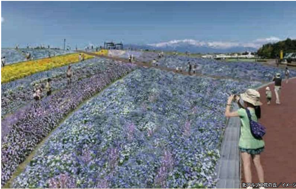
北アルプス花の丘 / イメージ