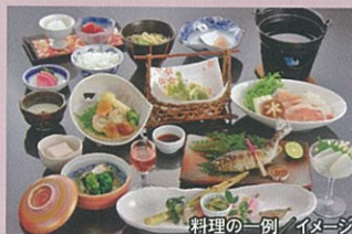
料理の一例 / イメージ