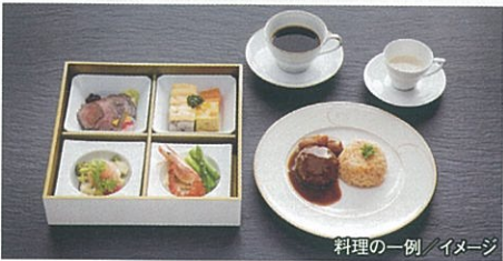
料理の一例 / イメージ