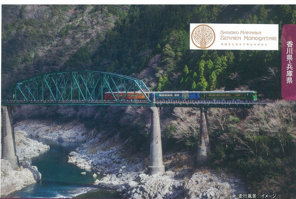
走行風景 / イメージ

金刀比羅宮の玄関口・琴平から、絶景の渓谷・小歩危、大歩危峡へ。美しい車窓を眺めながら「レストラン神椿」の料理長監修「さぬきこだわり食材の洋風料理」をお召しあがりください。