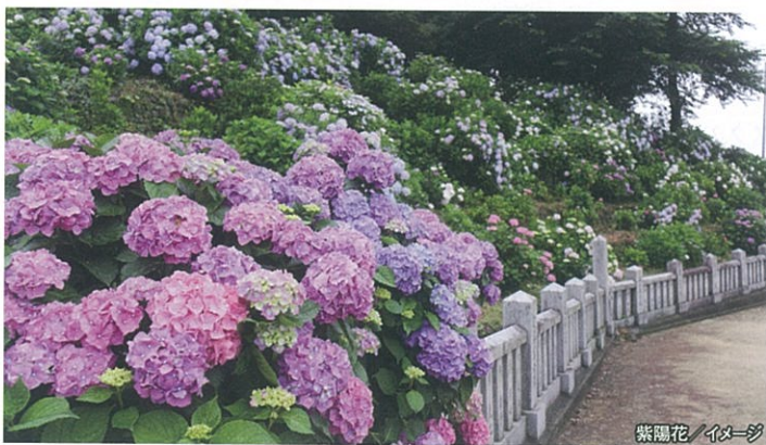
紫陽花 / イメージ