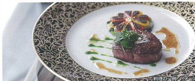
料理の一例/イメージ