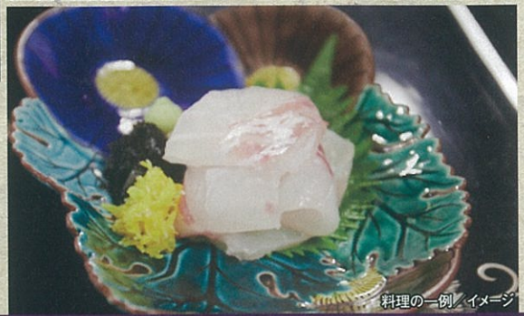
料理の一例/イメージ