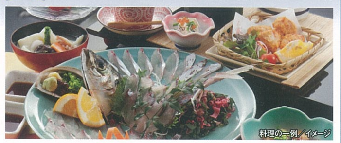
料理の一例 / イメージ