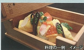
料理の一例/イメーシ