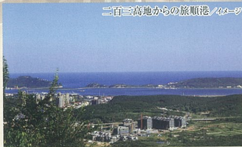
二百三高地からの旅順港 / イメージ