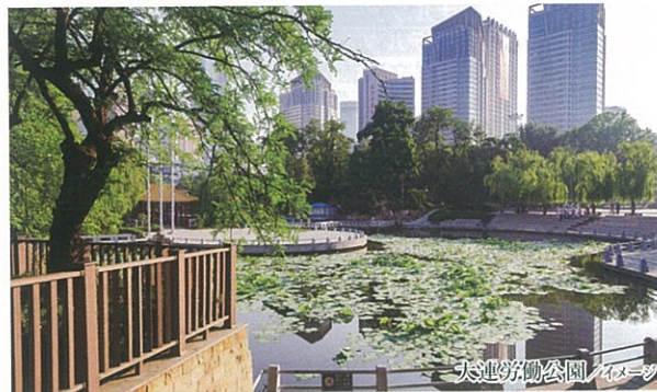
大連労働公園 / イメージ