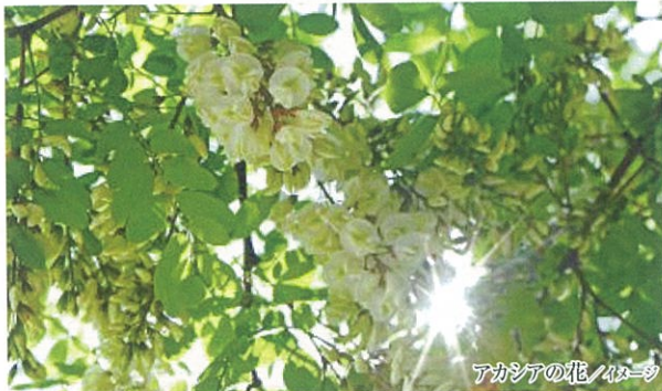
アカシアの花 / イメージ