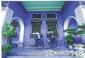
ブルーマンション