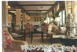
ジムトンプソンティールーム