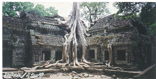
タブロム/イメージ