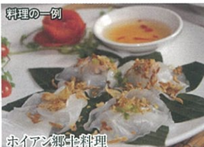
ホイアン郷土料理