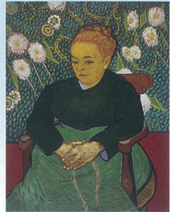
フィンセント・ファン・ゴッホ(子守唄、ゆりかごを揺らすオーギュスティヌ・ルーラン夫人) 1889年 Bequest of John T. Spaulding, 48,548

「ボストン美術館の至宝展—東西の名品、珠玉のコレクション」 2017年10月28日(土)～2018年2月4日(日) 神戸市立博物館