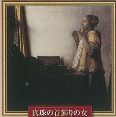
真珠の首飾りの女