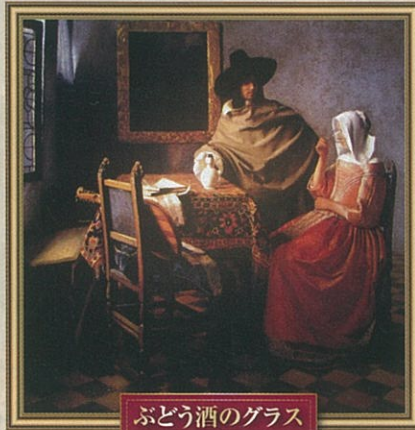
ぶどう酒のグラス